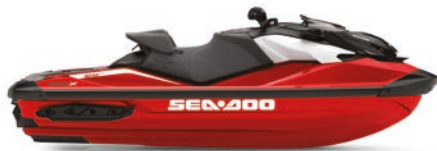
NEW Fiery Red Premium