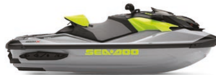
NEW Ice Metal and Manta Green